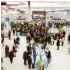
Les lauréats de "play your airport"