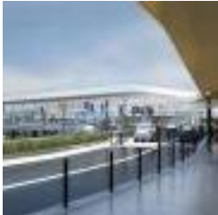
Programme de modernisation des aéroports parisiens