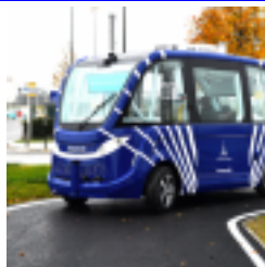
Express le cadre est fixé