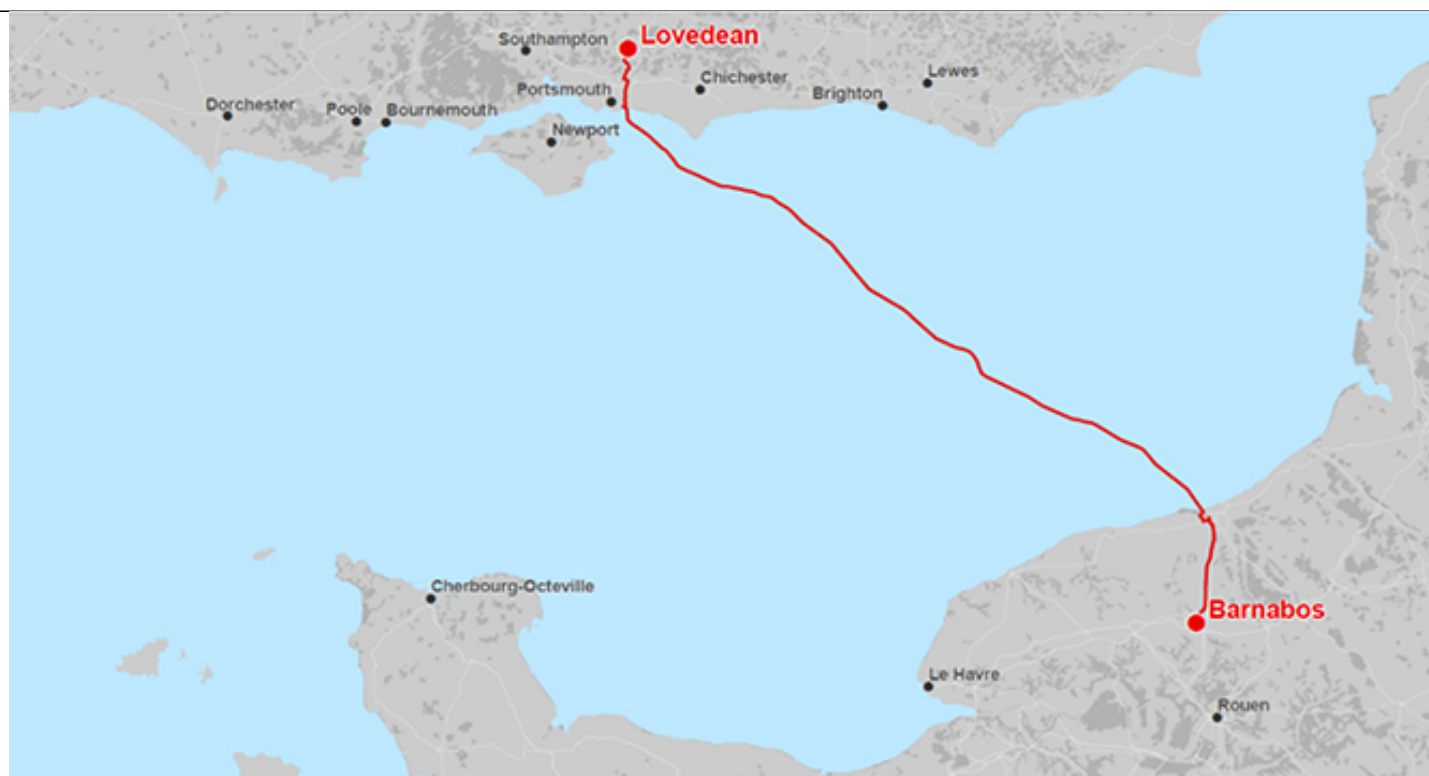
Tracé privilégié à ce stade